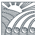
Г Р У П П А Ч Т П 3